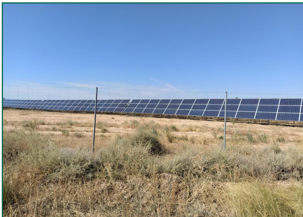
Fotografía 3. Vallado perimetral.

Con objeto de realizar un seguimiento de fauna se han realizado las siguientes acciones: