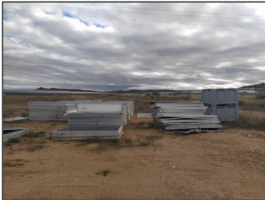
Fotografía 5. Zona de acopio de placas solares deterioradas.