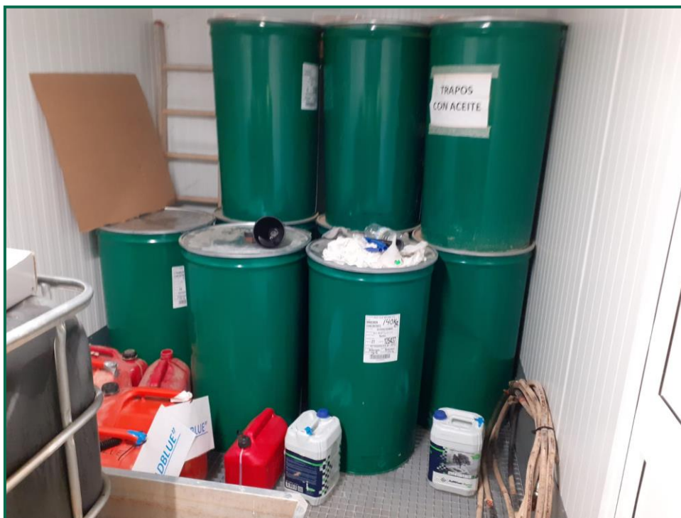
Fotografía 6. Bidones para residuos peligrosos.