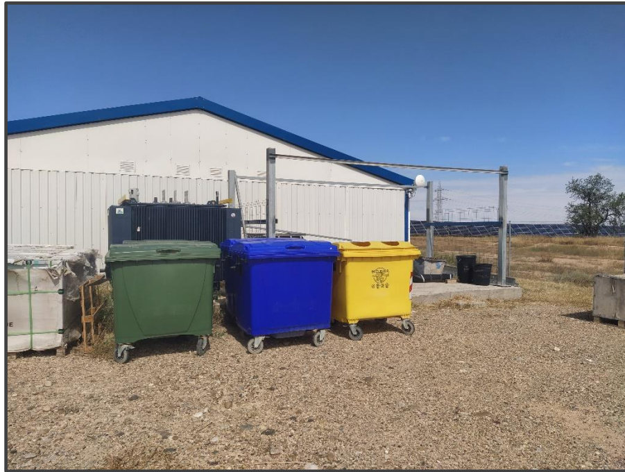
Fotografía 4. Contenedores de residuos.