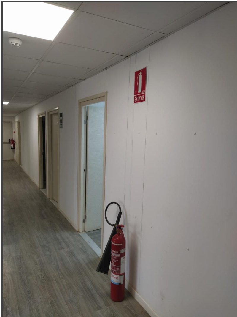
Fotografía 7. Extintores en edificio de control.

En las visitas se ha comprobado la disposición de equipos extintores de incendios en las instalaciones. Los extintores se encuentran ubicados en los edificios y en la Subestación.