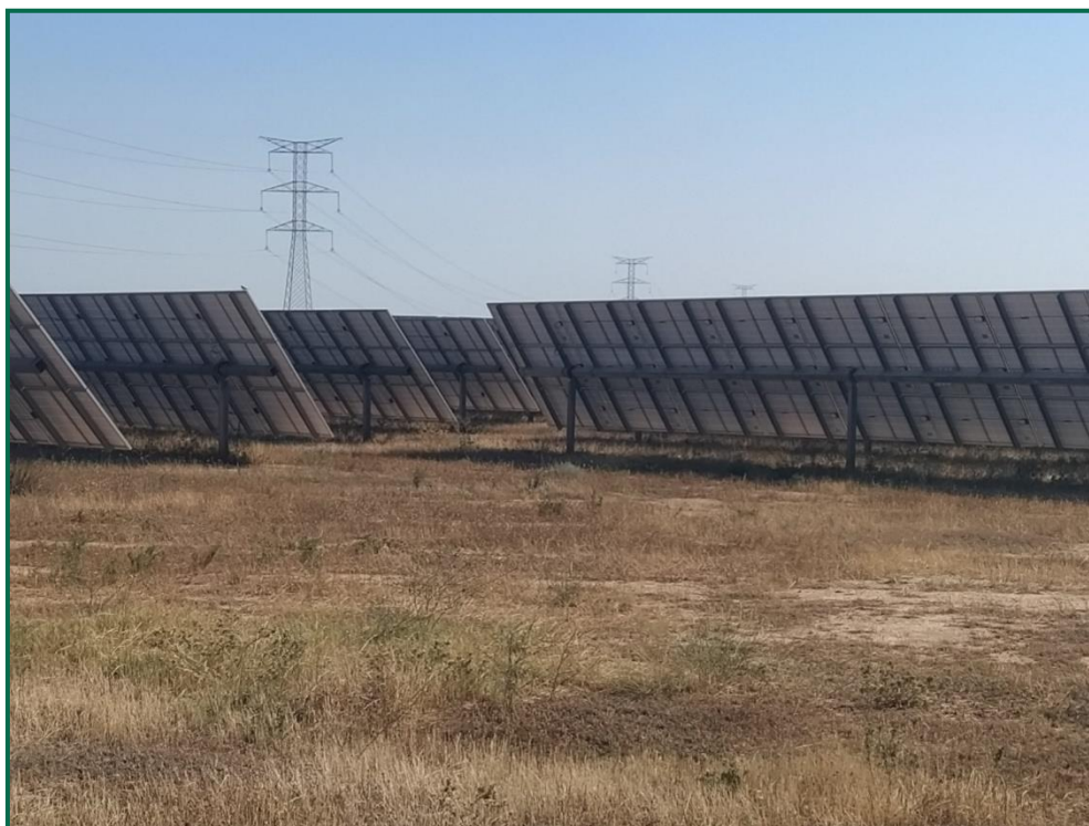
Fotografía 1. Vegetación entre placas actualmente.

Se ha realizado un seguimiento de la evolución de las revegetaciones realizadas durante los meses de invierno de 2020. Estas plantas se desarrollan, aunque se ha observado la desaparición de algunos ejemplares. Durante la primavera se produce un desarrollo de la vegetación espontánea de la zona, que en ocasiones compite con la vegetación plantada. En todo caso esta proliferación vegetal contribuye a evitar la erosión. Se realizará un control de mallas con objeto de reponer esta vegetación donde sea necesario.