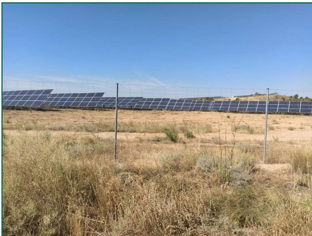
Fotografía 2. Zona revegetada.